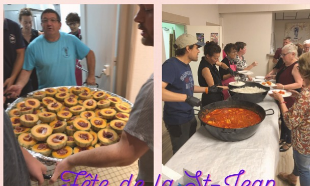
Fête de la St-Jean